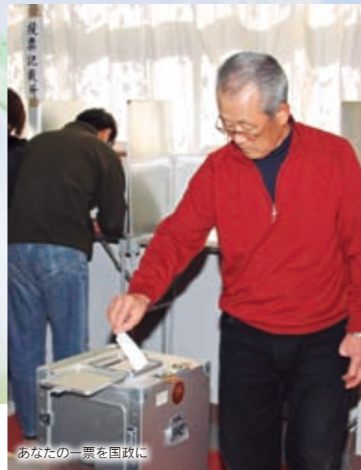
あなたの一票を国政に

問い合わせは 選挙管理委員会事務局 ☎898-6742 入場券については 市民課 ☎898-6102