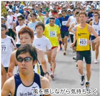
風を感じながら気持ちよく

申し込み 6月8日(金)までにランネット ( http://runnet.jp/ ) で(各種目定員になり次第締め切り) 費用 ①(高校生以上) 各3,000円 (小学生) 各1,000円 申込書の配布 市役所、各支所・公民館・市民サービスセンター、市有施設で 申し込み 6月8日(金)までにランネット ( http://runnet.jp/ ) で(各種目定員になり次第締め切り)