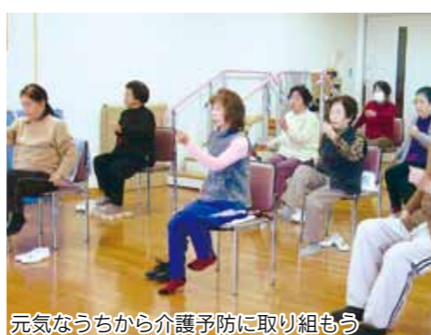
元気なうちから介護予防に取り組もう

「昔より転びやすくなった」「最近、口の渇きが気になる」そんな人はいませんか。それは老化のサインかもしれません。本市では、高齢者が日々の生活に必要な健康と身体機能を維持していけるよう、介護予防の取り組みに力を入れています。