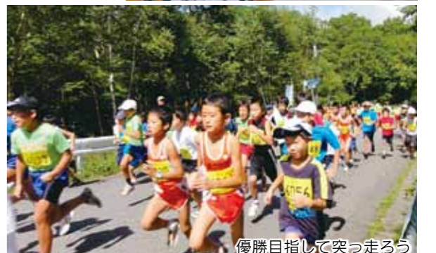
優勝目指して突っ走ろう