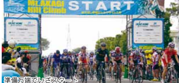
準備万端でいざスタート