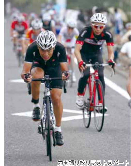
力を振り絞りラストスパート