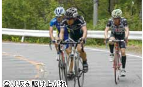
登り坂を駆け上がれ