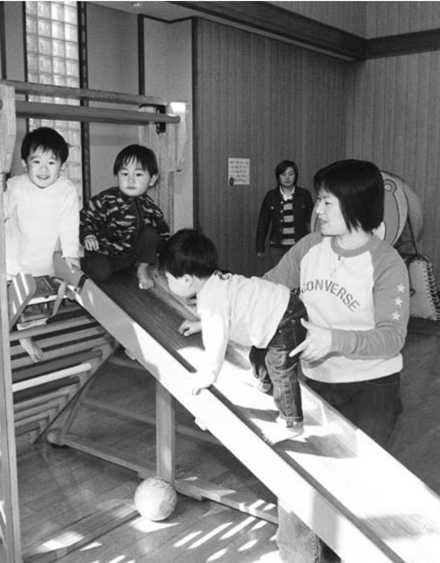
みんなで仲良く遊ぼうね（下小出児童館）

子どもへの悲惨な虐待が新聞やテレビなどで連日のように報道されています。児童虐待は今後の子どもの成長や人格の形成に大きな影響を与えることも。児童虐待の早期発見・未然防止には、地域の協力が必要です。本市でも、児童虐待防止ネットワーク会議を設置。虐待防止活動を積極的に進めていきます。