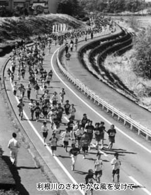
利根川のさわやかな風を受けて