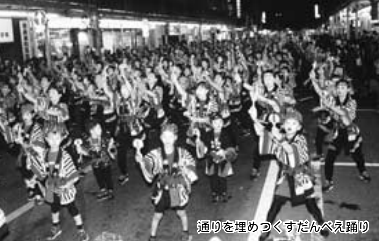
通りを埋めつくすだんべえ踊り

十月十一日・十二日の二日間、立川町通りなどで五十五回目となる「前橋まつり」を開催します。みこしやだんべえ踊り、パレードなどたくさんの方が参加し熱気いっぱい。なお、今年から初日の開始時間を早め、十一日は午前十時三十分から開始。だんべえ踊りに新しくコンテスト形式を取り入れることになりました。ぜひ、皆さんでご覧ください。 問い合わせは商業観光課 890 6606、商工会議所 234 5111へ。