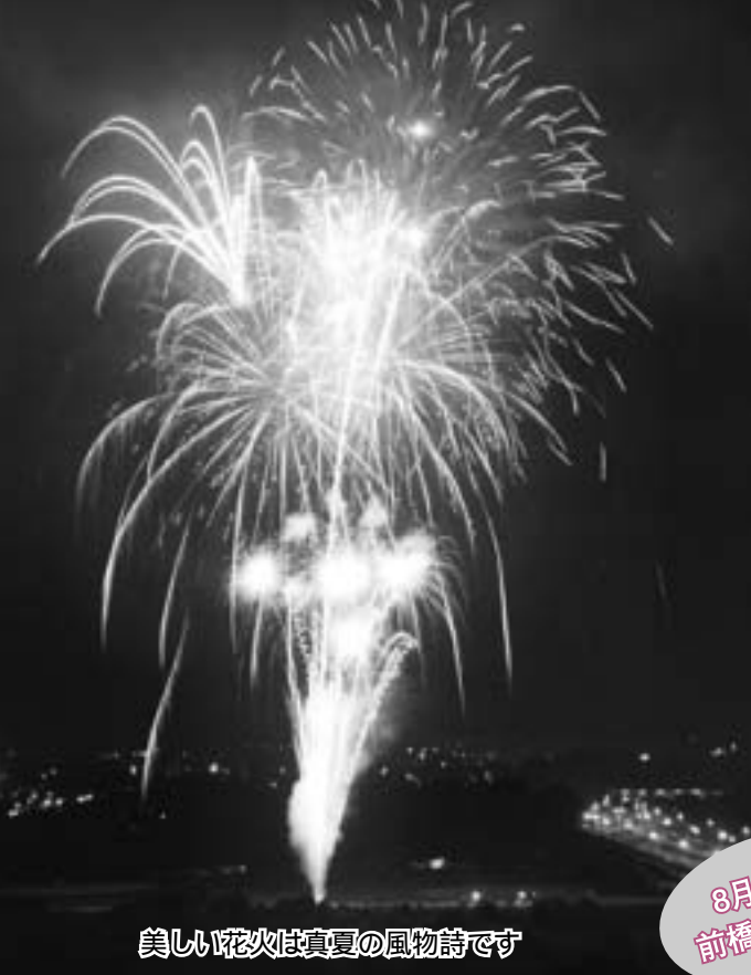
美しい花火は真夏の風物詩です