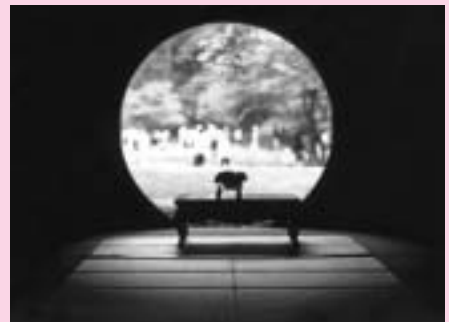
明月院などの名所を巡ります

勝寺 寿福寺 鎌倉駅 鎌倉大仏コース: 稲村ヶ崎駅 長谷寺 高德院 鎌倉駅 北条時宗コース: 北鎌倉駅 円覚寺 東慶寺 明月院 建長寺 鶴岡八幡宮 鎌倉駅 鎌倉フリーコース 横浜フリーコース 定員 各日とも先着六百六十人 参加費 上表のとおり。 申し込み 1月20日 からびゅうプラザ前橋 224 2260へ電話で 問い合わせは観光協会(商業観光課内) 890 6606へ。