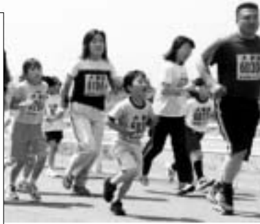
家族でも気軽に参加を

日時 4月27日 午前9時30分 スタート コース 左図のとおり 対象 小学生以上 種別 十二 五 三