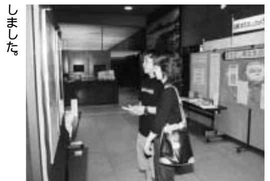
男女共同参画週間にはパネル展示も

希望する職場、自治会などのグループに、市の担当職員が男女共同参画について出前（お届け）します。今年も、地区のグループや学校などに四回出向き、男女共同参画社会の現状や課題などを分かりやすく説明