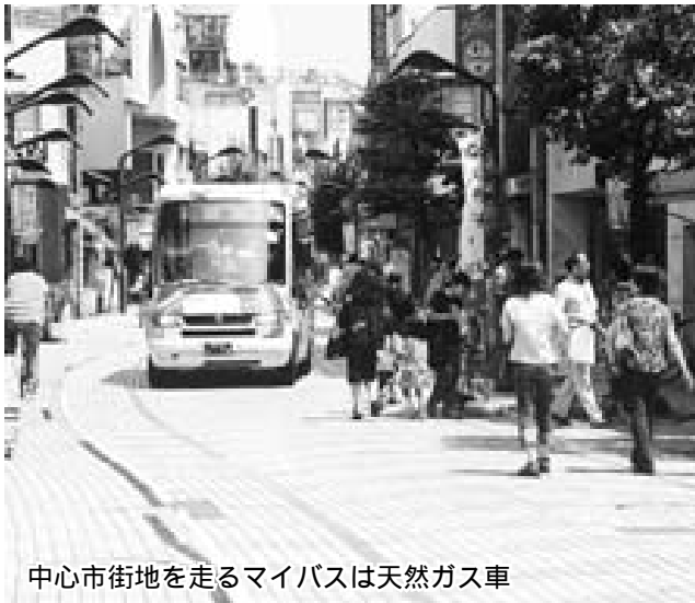
中心市街地を走るマイバスは天然ガス車