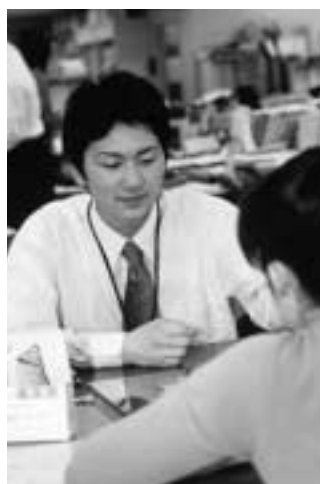
親切丁寧 に市民と対 応

来年四月一日付で、採用予定の職員採用試験を行います。試験の概要は左表のとおりです。採用予定数は次号でお知らせします。 「試験案内」は市役所5階職員課または支所・出張所にあります。郵送で請求する場合は、