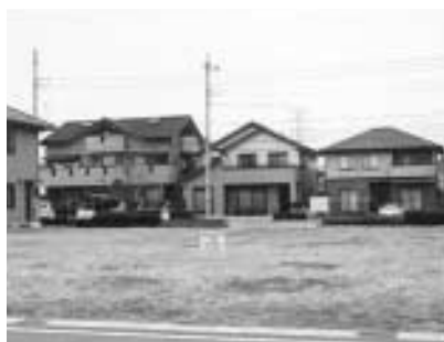
新しい家が並ぶ東善住宅団地