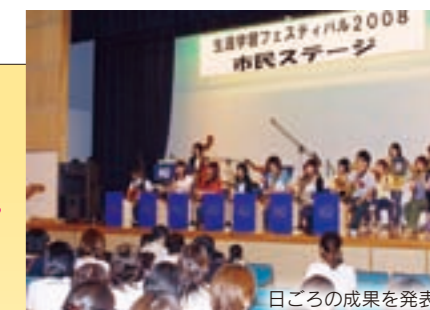
日ごろの成果を発表