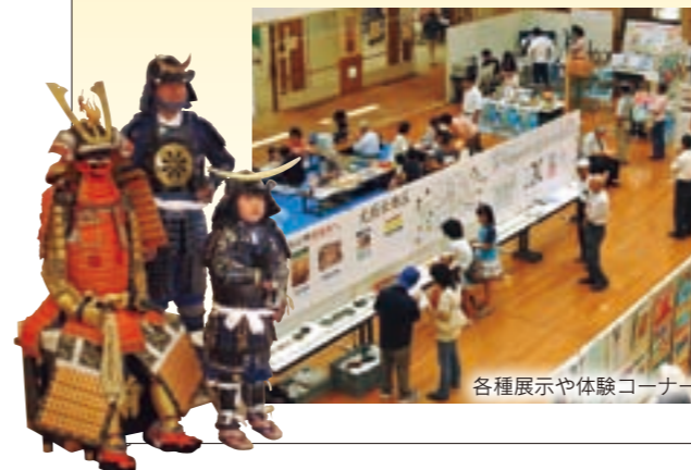
各種展示や体験コーナー