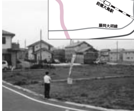
整備された西地区の分譲地

た、同組合のホームページでもお知らせしています。アドレスは http://www.city.maebashi.gunma.jp/maekodan/index.html 。団地の概要 所在地：堤町 交通機関：日本中央バス「大至公園行き」でJR前橋駅から約二十五分、「ローズタウン西」下車 施設：上水道、公共下水道、LPガス基地から各戸へ供給 学校区：桂萱東小、桂萱中 用途地域：市街化区域（第一種低層住居専用地域）地区計画による制限あり）面積・価格 上表のとおり。 分譲案内パンフレットの配布 執行時間内に市役所工業課へ直接 …問い合わせは前橋工業団地造成組合(工業課内) 890 6615へ。