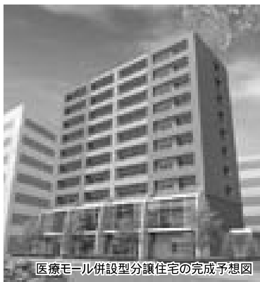
医療モール併設型分譲住宅の完成予想図

民間活力による中心市街地のにぎわい再生を目指して実施した「旧消防庁舎跡地（本町一丁目）整備に関する提案競技」の結果、第一位提案に「医療モール併設型分譲住宅」が選ばれました。今後、事業の具体化に向け協議を進めます。