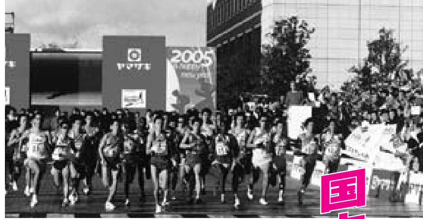
県庁を各チーム一斉にスタート

再生戦略会議の提案 Q 提案には実施困難なものがあるのではないですか。また、メンバーはどのような人が選任されているのですか。 A 再生戦略会議の提案は、十人の委員の皆さんが、一年間にわたり一生懸命に議論を重ねてまとめたものを、そのまま公表しました。実現が難しいものもありますが、市民の皆さんと意見交換をしながら、具体化できるものから実施したいと考えています。なお、委員は、公募した市民男女四人ずつと、学識経験者として前橋工科大教授、県職員を選任しました。 行政地区ブロックの変更 Q 下大島町は小学校区や子ども会などは永明地区ですが、自治会の行政区は城南地区に入っています。不便なので永明地区に統一できないでしょうか。 A 町にはそれぞれ歴史や伝統があり、地域のつながりがあります。地域の要望が強く皆さんの意見がまとまれば、要望に沿えるようにしたいと考えています。 東急イン前国道50号の五差路の改良 Q 国道50号が赤城県道などと交差する五差路は、とても不便です。改良の予定はありませんか。 A 以前からこの交差点には改