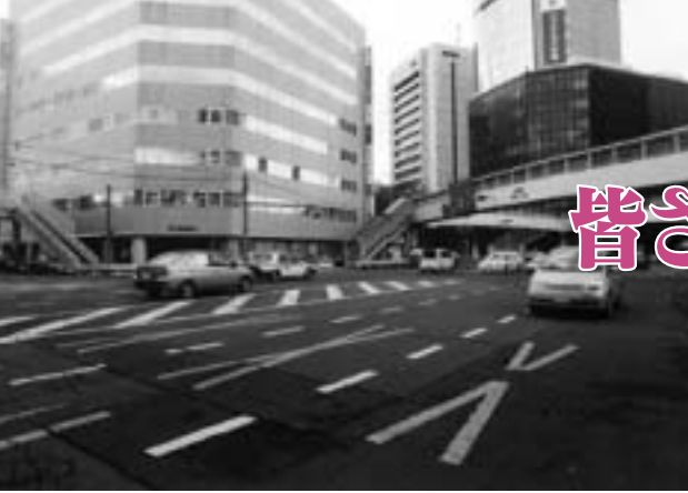
本町二丁目五差路の改良は国へ要望