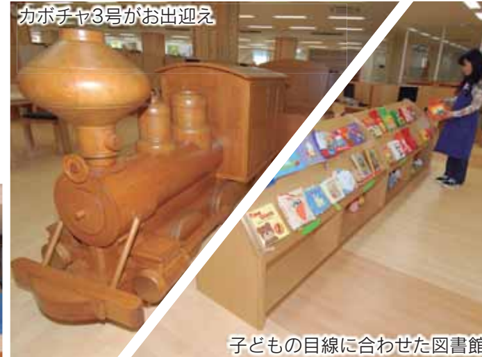
カボチャ3号がお出迎え