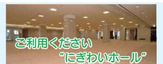
ご利用ください “にぎわいホール”

前橋プラザ元気21の1階にあるにぎわい ホールは、約500㎡の広さがあり、各種イ ベント、展示会など幅広く利用できます。 利用時間=午前9時~午後10時 使用料=〈入場料を徴しない場合〉1時間 当たり1,000円、〈入場料を徴する場合〉1時 間当たり3,000円 申し込み=にぎわい観光課☎210-2188へ