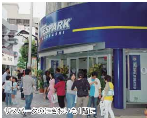
ザスパークのにぎわいも1階に