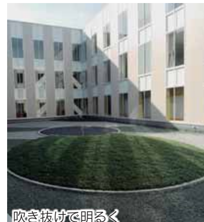
吹き抜けて明るく