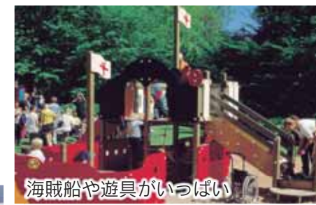
海賊船や遊具がいっぱい