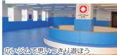
広いジムで思いっきり遊ぼう