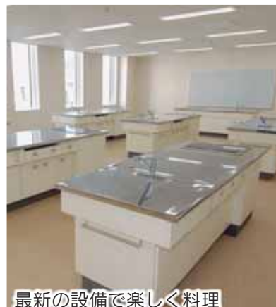
最新の設備で楽しく料理