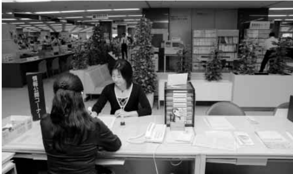
情報公開の請求は市役所 2 階で

お問い合わせは行政管理課 ☎ 890-6533、情報公開コーナー ☎ 890-6244へ。