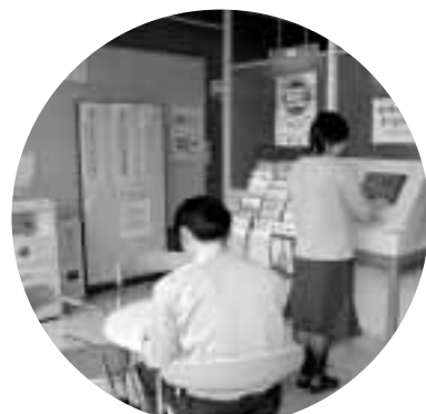
粕川支所の情報提供コーナー

市役所 2 階にある情報公開コーナーでは、情報公開に関する相談や行政情報の公開請求、個人情報の開示請求を受け付け。請求は窓口での申し込みが原則ですが、行政情報の公開請求に限り、電子メール、ファクス、郵送などでも受け付けます。 また、大胡・宮城・粕川支所には情報提供コーナーを設置。市の刊行物やまえばしネット端末などが閲覧できます。コピーが必要な人は、1面10円のコイン式コピー機がありますので、ご利用ください。