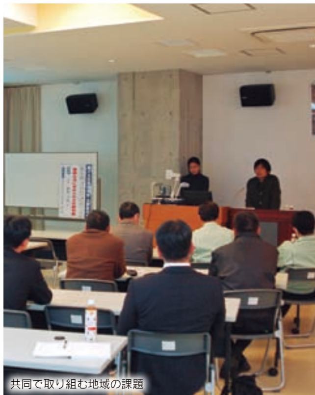
共同で取り組む地域の課題