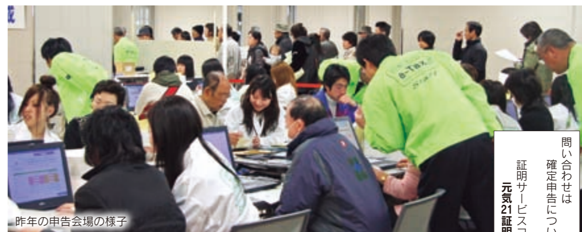
昨年の申告会場の様子

■元氣21証明サービスコーナーの業務時間を延長 確定申告窓口の開設に合わせ、元氣21証明サービスコーナーの利用可能時間を延長します。 日時 2月5日(金)～3月15日(月)、午前9時～午後7時（2月21日と28日を除く土曜・祝日は午前10時から） 会場 前橋プラザ元氣21・1階にぎわいホール ■元氣21証明サービスコーナーの業務時間を延長 確定申告窓口の開設に合わせ、元氣21証明サービスコーナーの利用可能時間を延長します。 日時 2月5日(金)～3月15日(月)、午前9時～午後7時（2月21日と28日を除く土曜・祝日は午前10時から） 会場 前橋プラザ元氣21・1階にぎわいホール