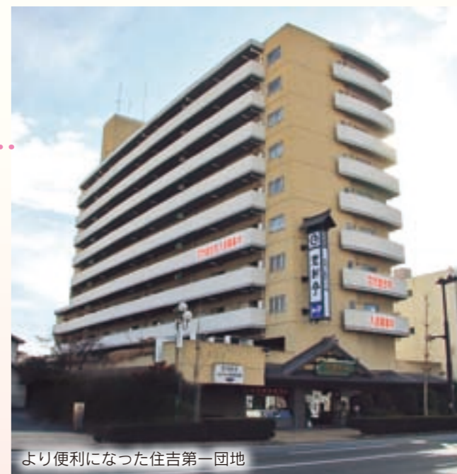
より便利になった住吉第一団地

家賃・戸数 =①5万8,500円、先着3戸②6万1,600円、同3戸。このほかに共益費と駐車場利用者はその使用料が掛かります