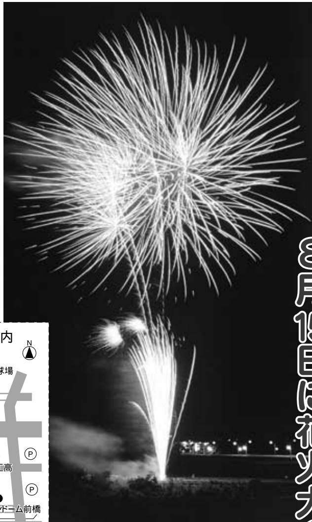
今年も盛大に行います