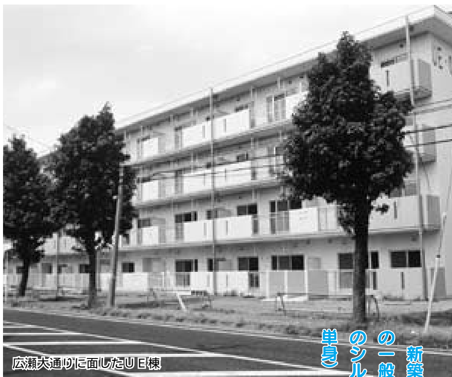
広瀬大通りに面したU-E棟