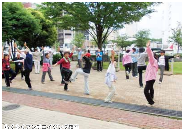
らくらくアンチエイジング教室

ば、多くの市民にとって恩恵のある事業が生まれるかもしれません。前橋市にとって必要なものであれば、パートナーシップ事業に、ぜひ、申し込んでください。 また、公開プレゼンテーションは、日頃交流のない団体同士が、他の団体の活動について知るよい機会です。この機会を生かして活動の幅を広げてもらいたいと思います。