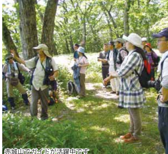
赤城山でガイドが活躍中です