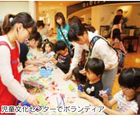
児童文化センターでボランティア