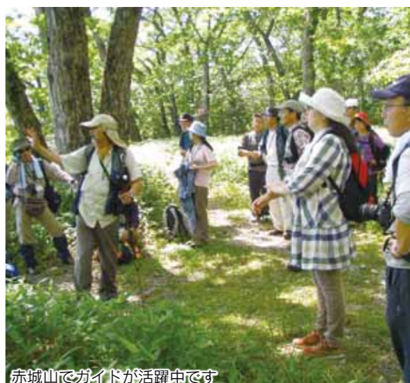
赤城山でガイドが活躍中です