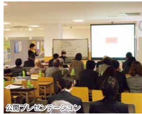
公開プレゼンテーション

■事業の企画提案を募集 市との協働で地域課題に取り組むための企画提案を募集します。市の支出金は1事業当たり上限40万円。選考は、1次審査(書類審査)と2次審査(公開プレゼンテーション)を行います。詳しくは市役所いきいき生活課や各市民サービスセンター、市民活動支援センターなどにお問い合わせください。