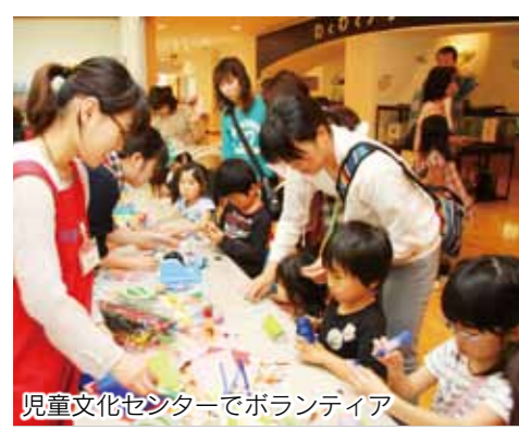
児童文化センターでボランティア