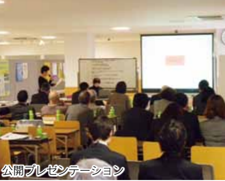
公開プレゼンテーション

■事業の企画提案を募集 市との協働で地域課題に取り組むための企画提案を募集します。市の支出金は1事業当たり上限40万円。選考は、1次審査(書類審査)と2次審査(公開プレゼンテーション)を行います。詳しくは市役所いきいき生活課や各市民サービスセンター、市民活動支援センターなどにお問い合わせください。