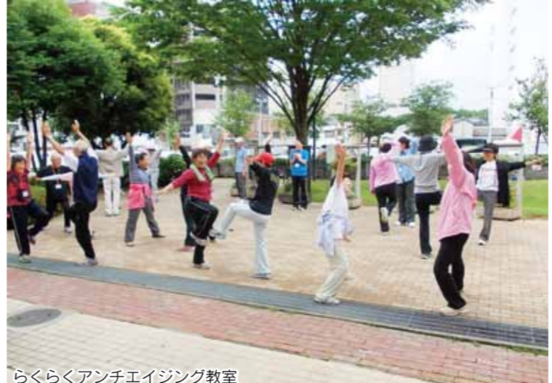
らくらくアンチエイジング教室

ば、多くの市民にとって恩恵のある事業が生まれるかもしれません。前橋市にとって必要なものであれば、パートナーシップ事業に、ぜひ、申し込んでください。 また、公開プレゼンテーションは、日頃交流のない団体同士が、他の団体の活動について知るよい機会です。この機会を生かして活動の幅を広げてもらいたいと思います。