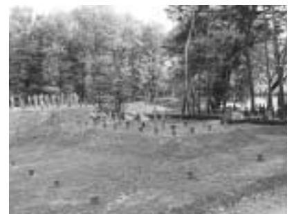
復元された小二子古墳

を、後二子古墳と中二子古墳と の間に設置しました。既に公開 している後二子古墳・中二子古 墳と一緒に見学してください。 なお、前二子古墳は現在整備 中で、古墳の周りから見学がで きます。今後は石室周辺の整備 を行い、整備終了後に公開する 予定です。 …問い合わせは文化財保護課 231 9531へ。