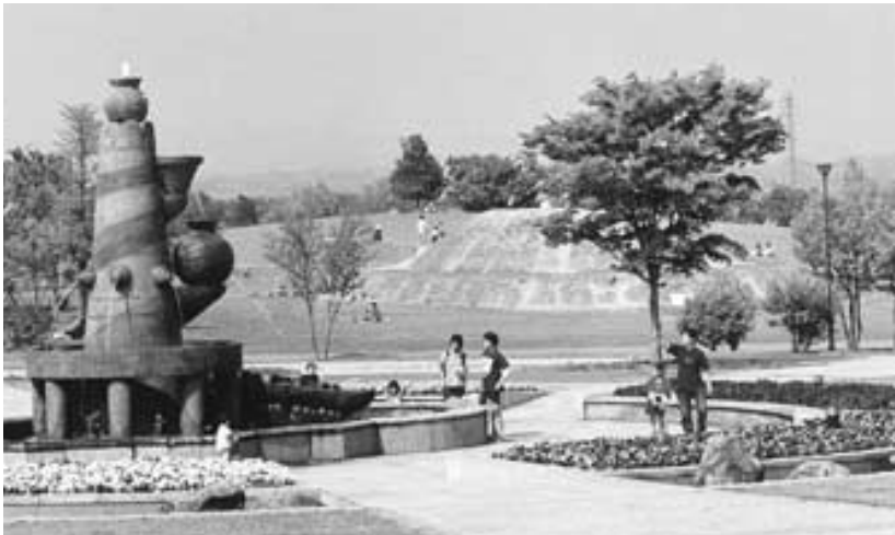
文化財や自然がいっぱいの大室公園