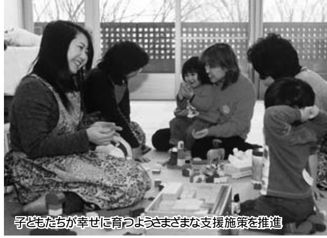
子どもたちが幸せに育つようさまざまな支援施策を推進

「前橋市次世代育成支援行動計画」を策定しました。計画に基づいて、子どもの幸せを基本に市民・地域・事業者・行政が連携し、次世代育成支援施策を実行していきます。