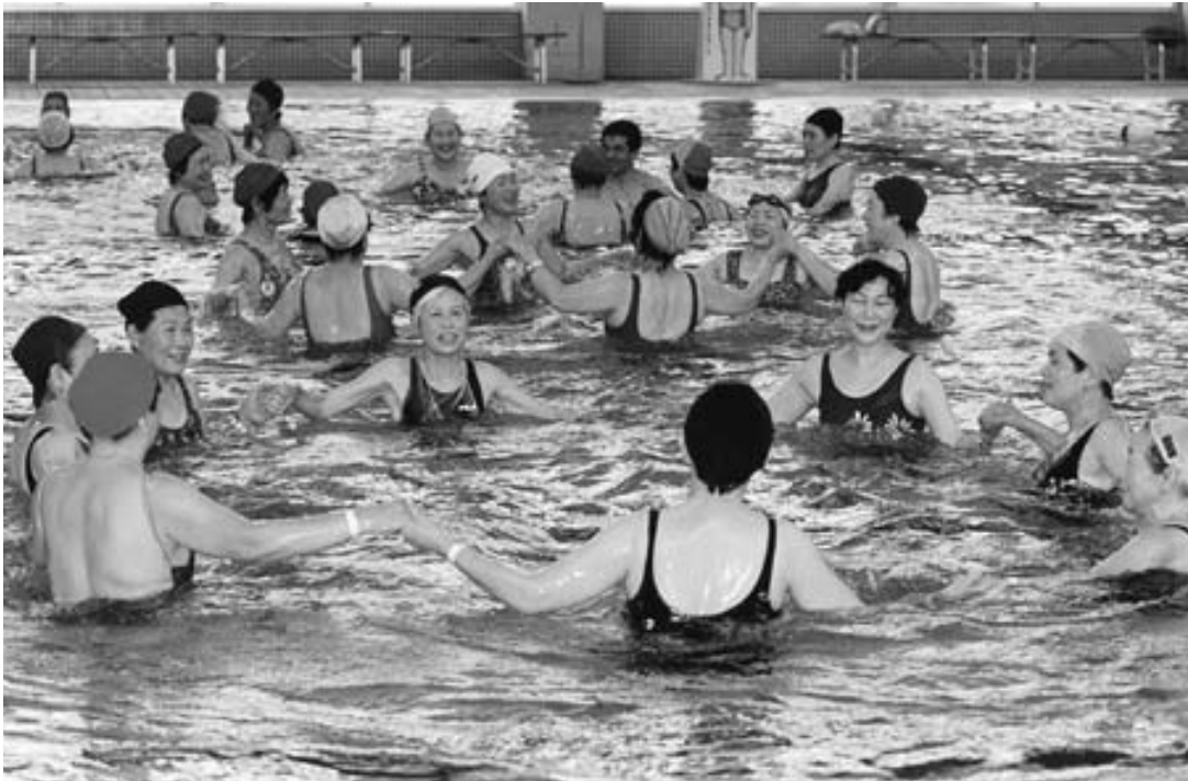
明るい社会づくりは健康な心身から（大渡温水プールの教室で）

また、在宅介護支援センターの整備や、介護保険各種サービス利用者の権利確保とサービスの質の向上、生活支援型訪問介護事業、生きがい対応型デイサ