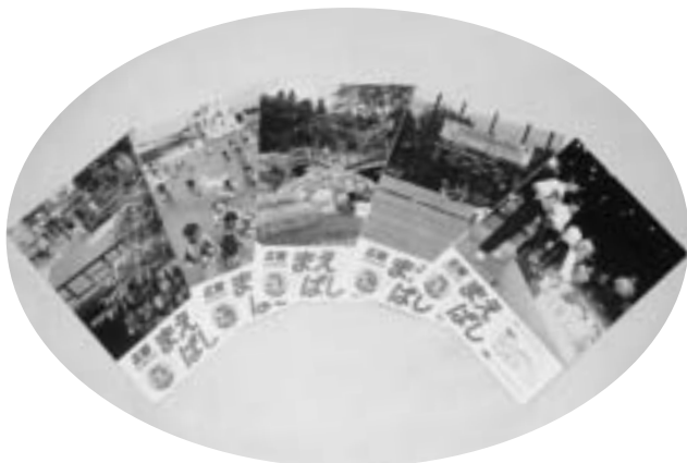
広報紙は市政を伝える中心です