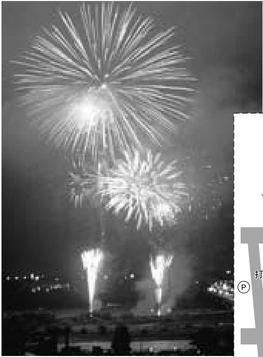
県都の夜空が色鮮やかに