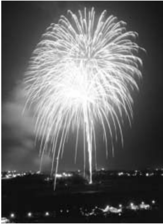
利根川西側河川敷で打ち上げる花火