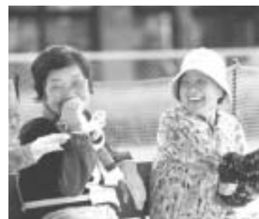
笑顔は長寿の秘けつ

九月十五日は「敬老の日」です。長年にわたり社会の発展のために貢献してきた皆さんに感謝し、長寿をお喜び申し上げます。これを機会に、わたしたちの先輩である皆さんを敬い、長寿を祝うとともに高齢者の福祉への関心を深め、高齢者の生活上に努めましょう。