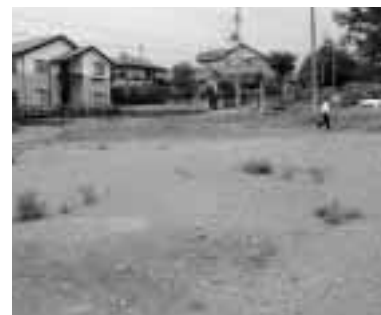
高花台二丁目の土地

前橋工業団地造成組合では、市内六区画の土地を公募で売却します。詳しくは、パンフレットをご覧ください。申し込みは六月二十九日(木)・三十日(金)の二日間。申し込みが重複した区画については、七月五日(水)に抽選を行います。 なお、このほかに堤町のローズタウン住宅団地などの宅地も分譲中ですので、お問い合わせください。 土地の概要Ⅱ右表のとおり パンフレットの配布Ⅱ執務時間内に市役所商工振興課、総合案内窓口、各支所・出張所