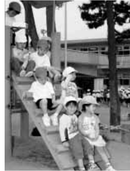
子どもの健やかな成長を支えます