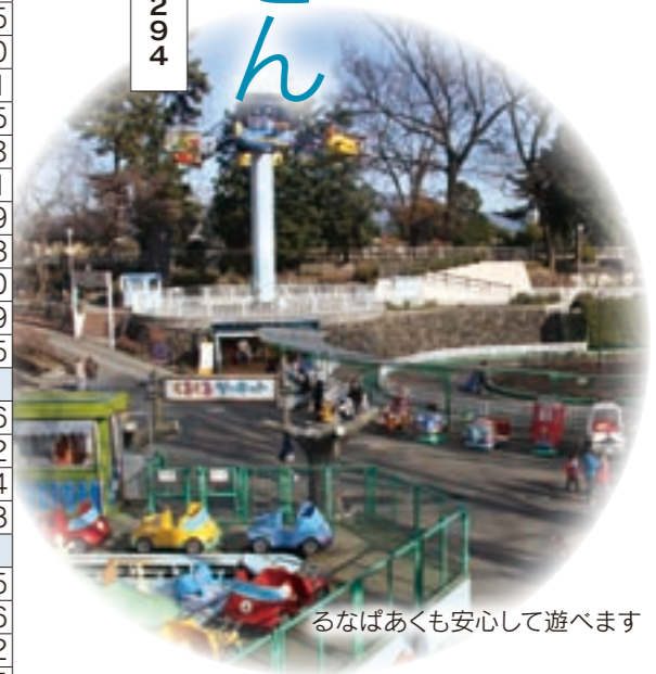
るなばあくも安心して遊べます