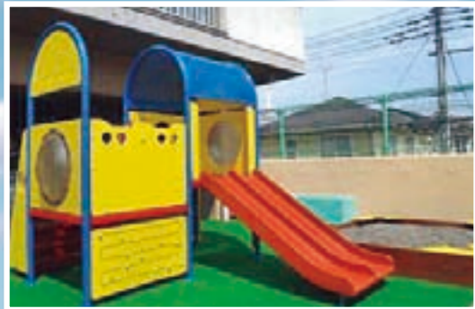
2階には子どもの遊び場も