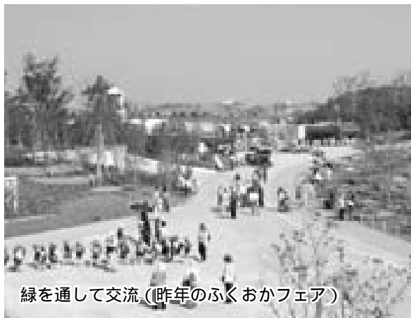
緑を通して交流(昨年のふくおかフェア)

「全国都市緑化ぐんまフェア」が平成二十年三月、本市と高崎市を中心に県内で開催されます。現在、県を中心に基本計画を策定中で、「ぐんまフェア」を広く周知し、成功させるため、次のとおり愛称とシンボルマークを募集。「ぐんまフェア」にふさわしく、親しみやすい愛称とシンボルマークを考えてください。 入選は四月下旬に本人へ通知。同一作品が複数ある場合は抽選で入賞者を決定します。 「緑化フェア」とは 全国都市緑化フェアの統一テーマは、「緑豊かなまちづくり」窓辺に花を・暮らしに緑を・街に緑を・あしたの緑をいまつくろ。都市緑化に対する意識の高揚と技術の普及などを図ると