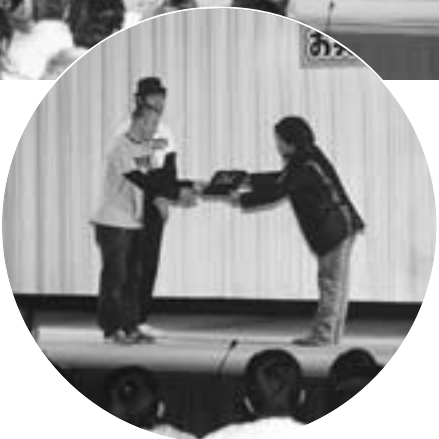
お笑いバトルの入賞者には賞品

日時：3月11日 午後6時 会場：グリーンドーム前橋 出演 場：仲寺、コントNO1ほか