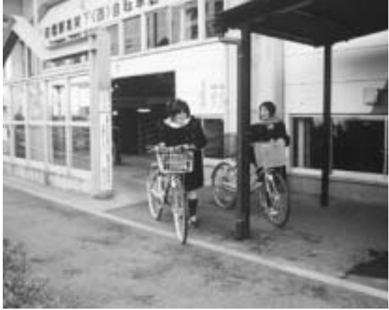
駅に近く安心して預けられます

皆さんも通勤や通学に公共交通機関と自転車を利用しませんか。JR前橋駅の東側・西側、駒形駅南口、新前橋駅東口、群馬総社駅前の六カ所にある市営有料自転車等駐車場では、来年度の年間定期利用の申し込みを受け付けます。希望者は指定された期間に、各駐車場の管理室へ申し込んでください。 なお、一カ月定期利用は毎月受け付けています。前月の二十五日から、各市営自転車等駐車場の管理室へ。 期間：4月1日～来年3月31日