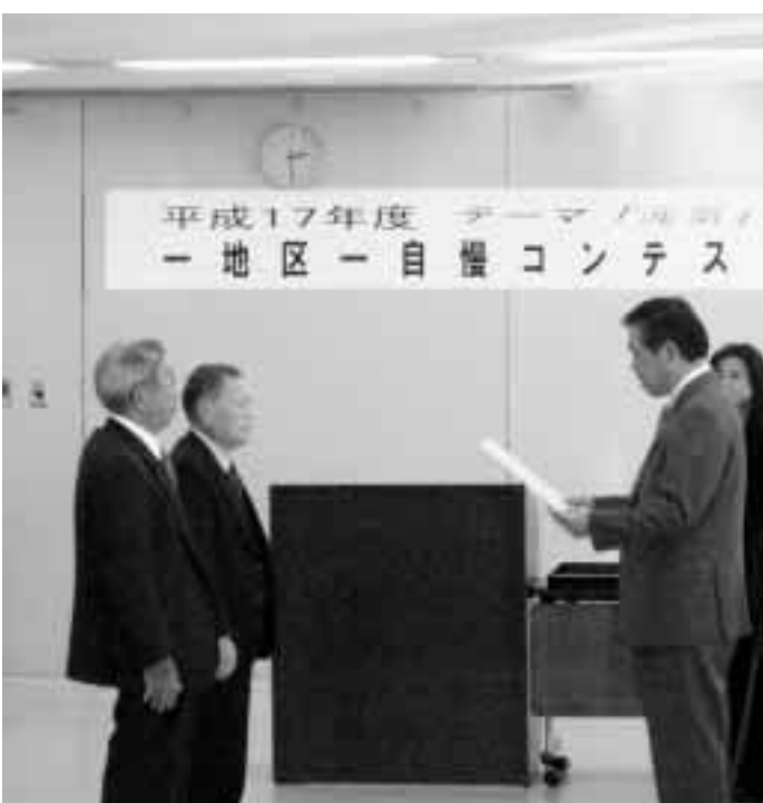
自慢大賞を受賞した田口町(昨年)

のなどで自慢できるものをご応募ください。ただし、前橋まつり、前橋七夕まつりなど全市のなもの、また、昨年度に受賞したものは対象外です。