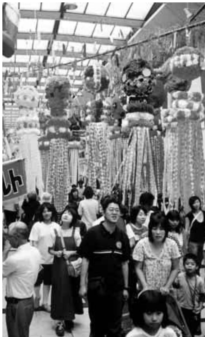
竹飾りが彩る北関東一の七夕まつり