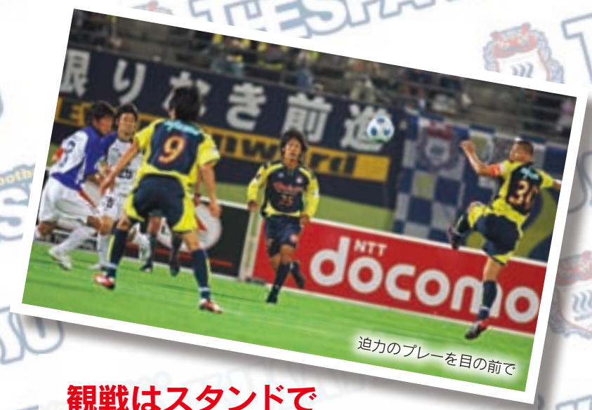
迫力のプレーを目の前で