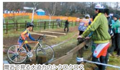
間近で見ると迫力のシクロクロス

ヒルクライム大会前日は、全国的にも珍しい都市部でのシクロクロスの大会を開催。不正地のコースで、オフロード自転車が柵や階段などの障害物を乗り越える見ごたえあるレースが展開されます。 日時＝9月28日(土)午前9時～午後2時 会場＝グリーンロード前橋北側特設会場（利根川河川敷）