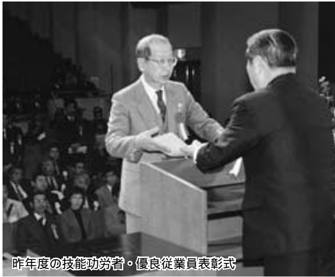
昨年度の技能功労者・優良従業員表彰式

市内の事業所に勤めている永年勤続従業員と企業員、献技術者などを表彰します。事業主または事業主が所属する同業団体の代表者は、該当する人を推薦してください。なお、表彰式は十一月十九日に前橋テルサで行います。