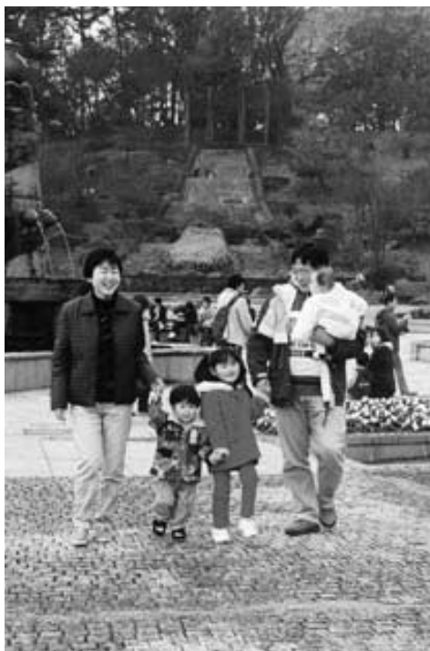
整備が進む大室公園は市民憩いの場