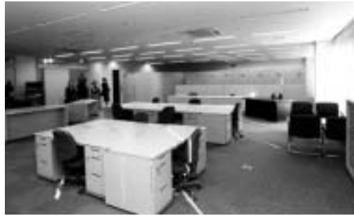
機能的で明るい事務室

市社会福祉協議会事務局 市職員研修会館(本町二丁目)から全面移転します。 また、これまで同館にあった、ヘルパーステーション、心配ごと相談所、おもちゃの図書館なども総合福祉会館へ移ります。 市ボランティアセンター 緑が丘町から総合福祉会館へ移転して、業務を行います。 福祉団体合同事務室 これまで市内に分散していたさまざまな福祉団体の事務局を集めて、合同事務室を設置。次