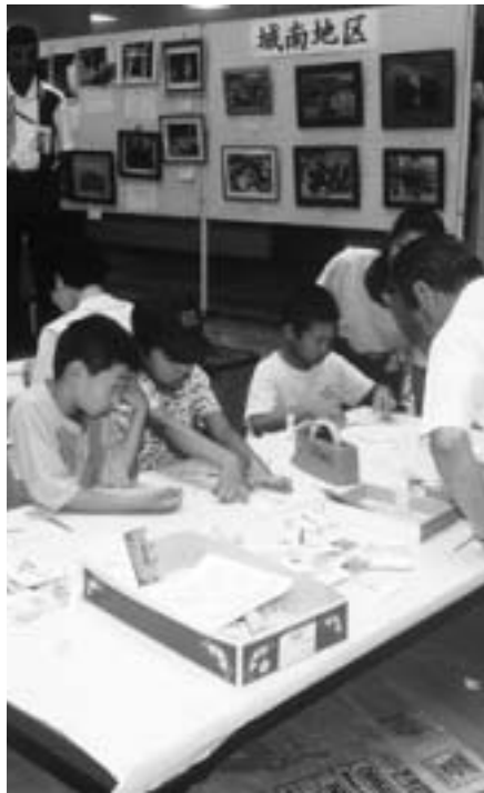
生涯楽しく学びましょう