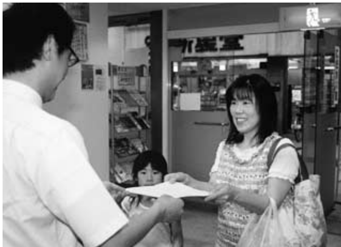
買い物ついでに利用できて便利です

にぎわい課に「証明サービスコーナー」を設置しました。中心商店街が一層便利になります。ぜひご利用ください。ただし、一部取り扱えない場合もあります。開設日時：12月29日～1月3日を除く毎日、午前10時～午後7時 場所：にぎわい課内（千代田町二丁目八 二二） 発行証明書：住民票の写し、住民票記載事項証明、印鑑登録証明書、戸籍および除籍の全部または個人事項証明書、除籍および原戸籍の謄抄本、戸籍記載事項証明身分証明書など …問い合わせは市民課 890 6107、証明サービスコーナー 210 2188へ。