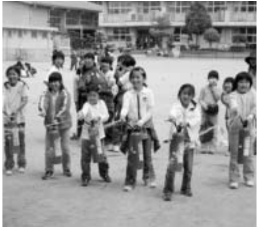
子どもたちから防火意識を持って

十一月九日 から十五日 まで、秋の火災予防運動」が実施されます。これからの季節は暖房器具などの火気を使用する機会が増えることから火災が発生