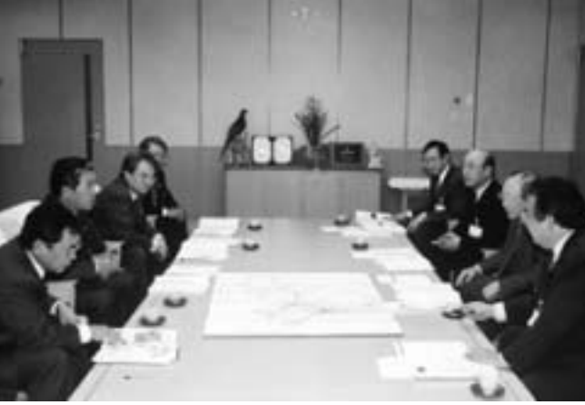
会議では一層の連携強化を確認

第十五回前橋・高崎連携市長会議を、十月十一日に高崎市長所で開催しました。「少子化対策の連携」前橋高崎市民オペラの開催」の話題のほか、既に行っている連携事業の進行状況についても話し合い、大きな効果があったことが確認されました。 少子化対策の連携 出産後の新生児、乳幼児に対する施策に加え、両市が連携して「マタニティパスジ（仮称）」を作成し、母子健康手帳の交付に併せて配布することとしました。これは妊娠初期の母体と胎児の安全、保護が目的。この取