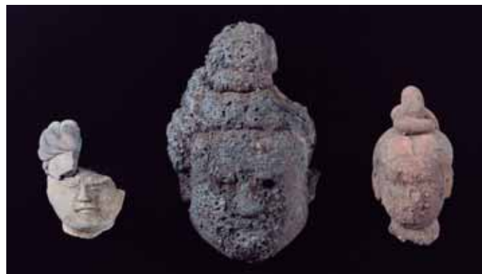
▲山王廃寺・塑像頭部