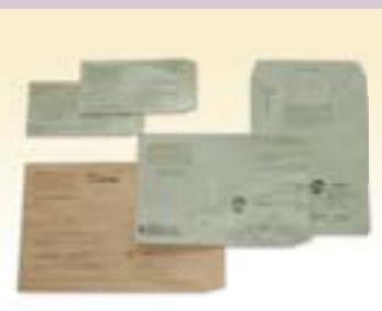
これらの裏面に掲載します

申し込み=10月31日(金)(農業所得収支内訳書用のみ10月15日(水)までに、所定の申込用紙に記入し、広告デザイン原稿を添えて市役所市民税課(☎898-6214)へ直接