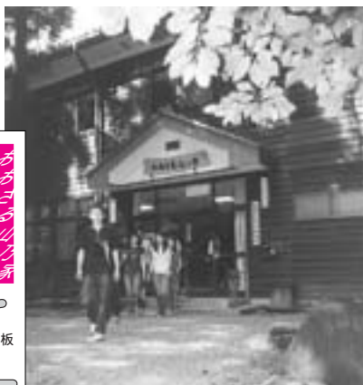
自然豊かな場所にあります