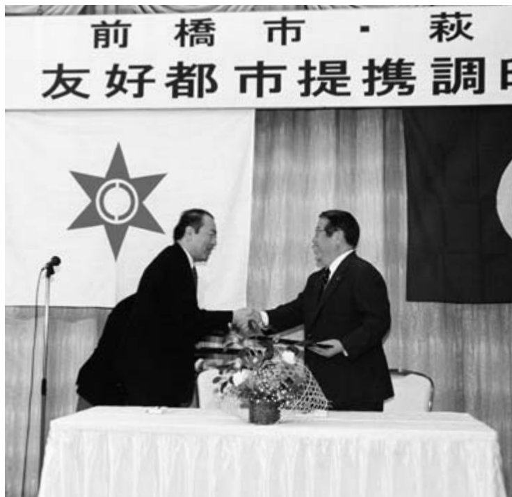
両市長が協定書に署名して 友情の握手

交流目的は、群馬県の初代県令（現在の県知事）で、萩市出身の榎取素彦の縁から歴史的友好関係を結ぼうというもの。観光、文化、教育、経済など各分野の交流を促し、相互の友好と繁栄を推進するのが目的です。萩市との友好都市交流は、友達としての親しい付き合いの関係で、市民相互の交流を進めてい