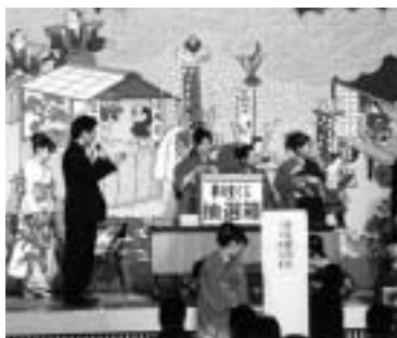
抽選会などのイベントも

アトラクションでは、「THEE 対面！恩師からのビデオレター」を行います。静粛な「式典」に続く「はたちのつどい」では、「未成年の卒業」募金はいかがかと迫力ある「和太鼓演奏」、豪華