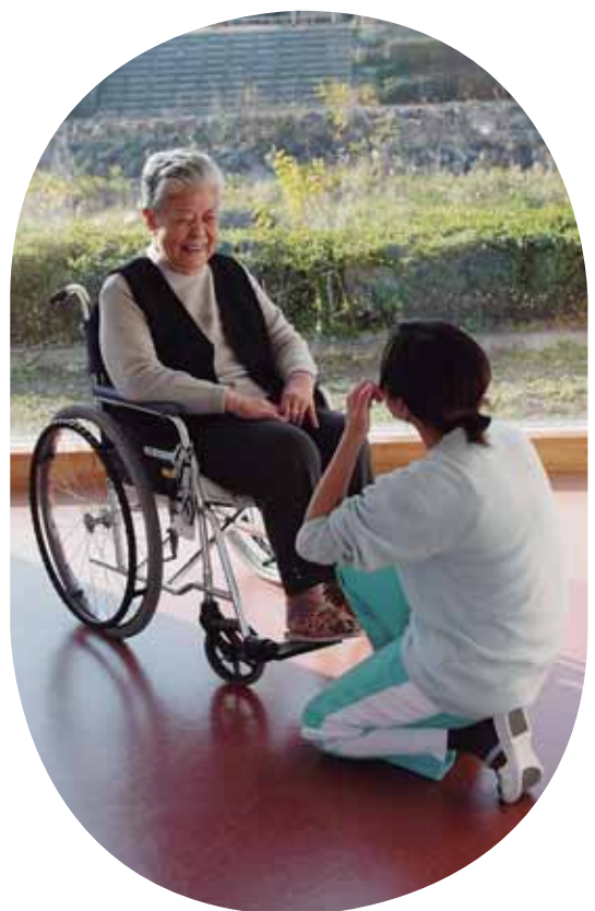
みんなが生きがいを持てる生活を