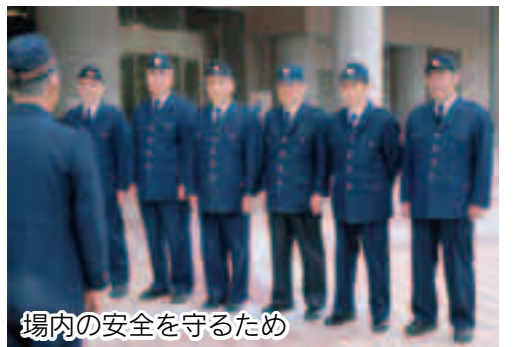
場内の安全を守るため