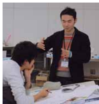
やりがいも感じて

実習補助や一般事務を行う嘱託職員を募集します。 募集職種 ①総合デザイン工学科実習補助・学科事務 ②一般事務 対象 ①は建築系の短大卒以上でパソコン経験のある人 ②はパソコン経験のある人、各1人（選考） 勤務時間 午前8時30分〜午後9時30分の6時間で週30時間 勤務場所 前橋工科大 申し込み 2月15日(金)（必着）までに郵送または直接。履歴書を〒377-1081 前橋市上佐鳥町460-1へ。