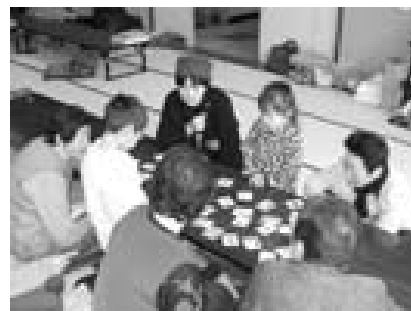
楽しい世代間交流

市の男女共同参画社会づくりのため、推進施策などを審議する委員を募集します。 応募人員=3人(選考) 対象=本市在住の20歳以上で市の付属機関などの委員でない人 任期=来年6月まで 申し込み=3月15日~31日に郵送または直接。住所・氏名・性別・生年月日・職業・電話番号を明記し、応募の動機・抱負を400字程度にまとめ、〒371-0023前橋市本町一丁目5-2・市職員研修会館内生活課(890-6517)へ