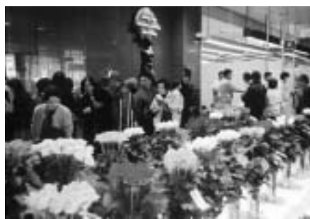
昨年の花共進会(市役所1階市民ロビー)

切り花や鉢花など百九十点を集め、市役所十二階市民ロビーで花共進会を開きます。花き生産農家が丹精を込めて栽培した美しい花をご覧ください。 展示 日時 3月6日・7日の執