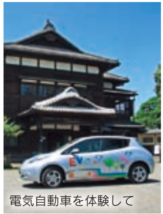
電気自動車を体験して