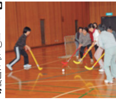
楽しく体を動かそう