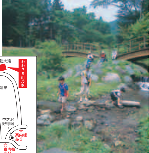
自然に恵まれた場所